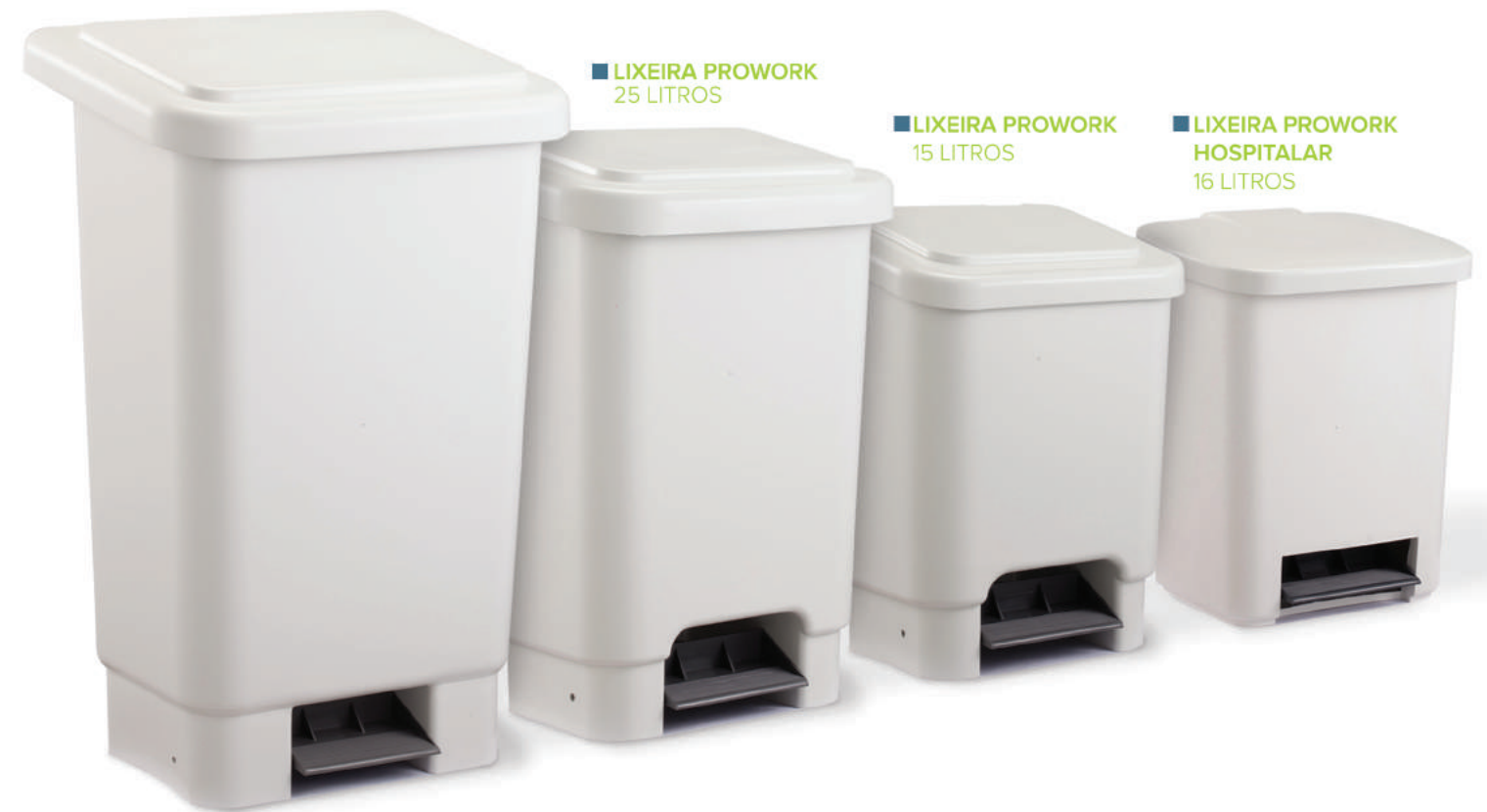
■ LIXEIRA PROWORK HOSPITALAR 16 LITROS